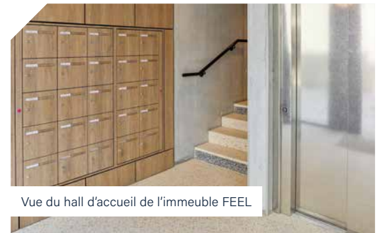
Vue du hall d'accueil de l'immeuble FEEL