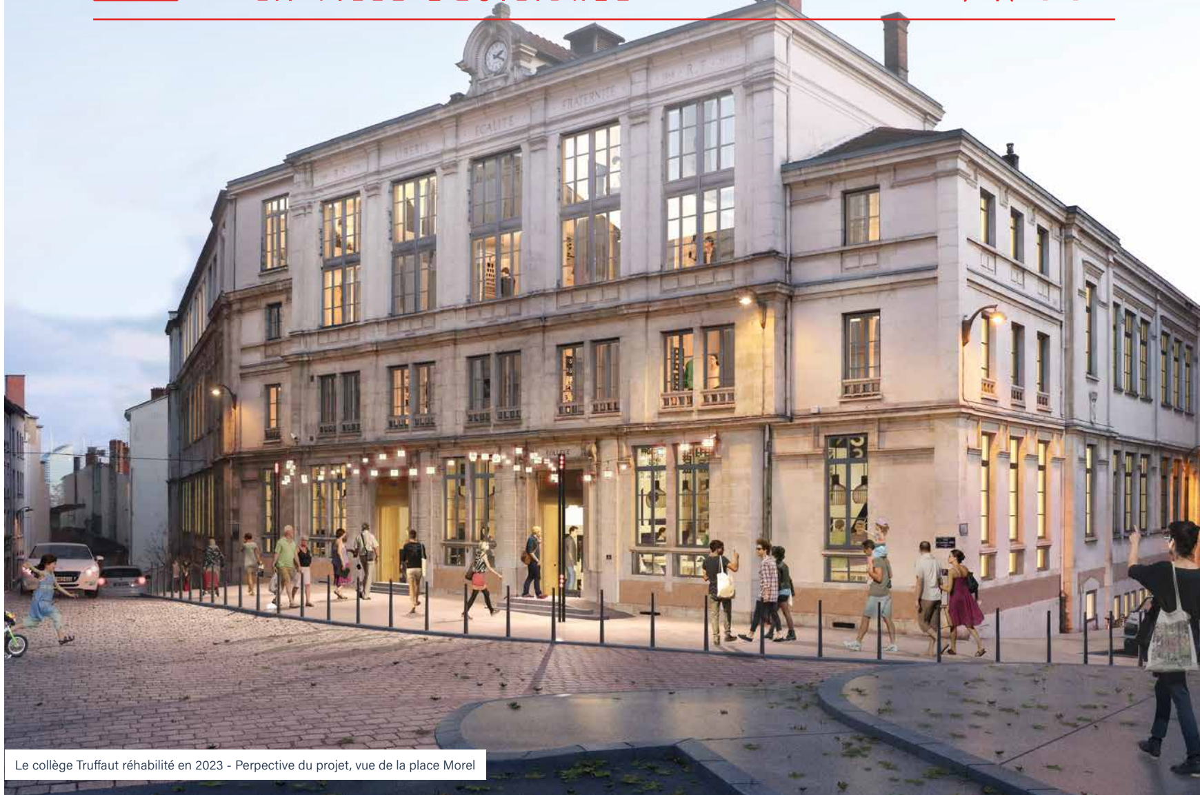
Le collège Truffaut réhabilité en 2023 - Perspective du projet, vue de la place Morel