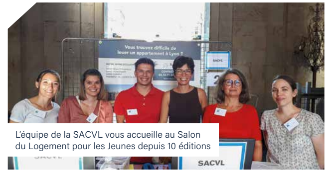
L'équipe de la SACVL vous accueille au Salon du Logement pour les Jeunes depuis 10 éditions

985 m 2 au service du quartier, des associations locales et de la BD