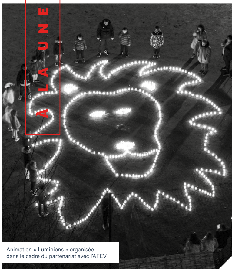
Animation « Luminions » organisée dans le cadre du partenariat avec l'AFEV