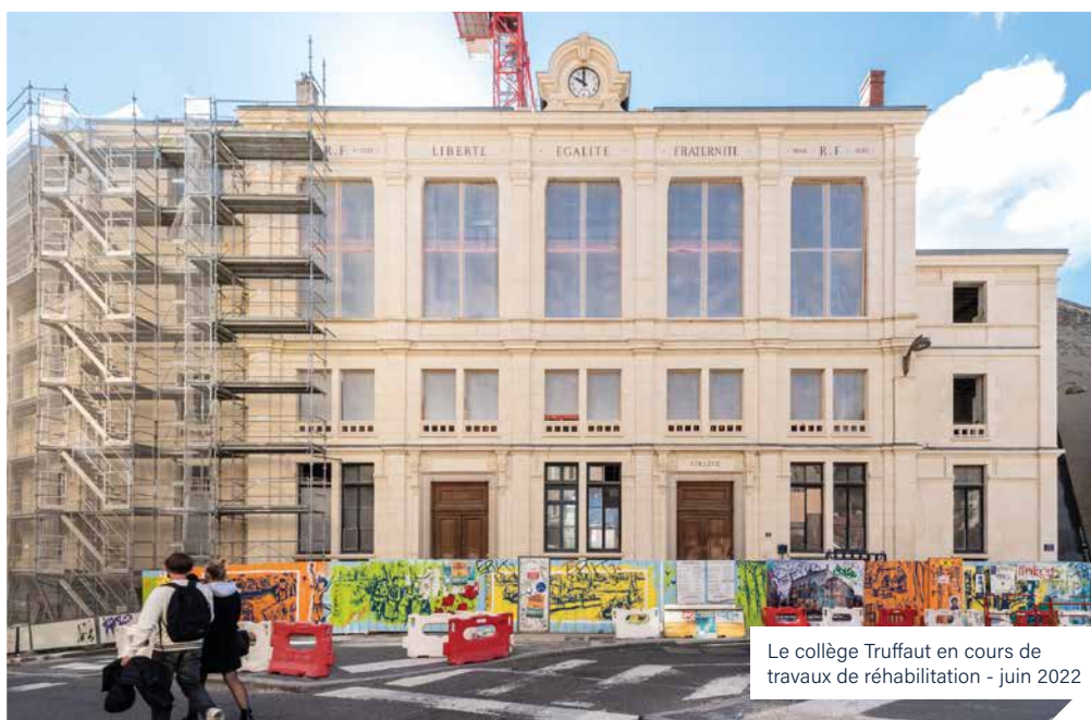
Le collège Truffaut en cours de travaux de réhabilitation - juin 2022