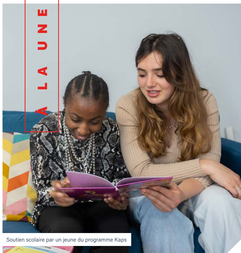
Soutien scolaire par un jeune du programme Kaps