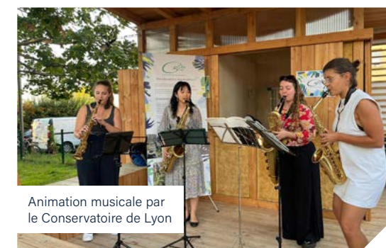
Animation musicale par le Conservatoire de Lyon