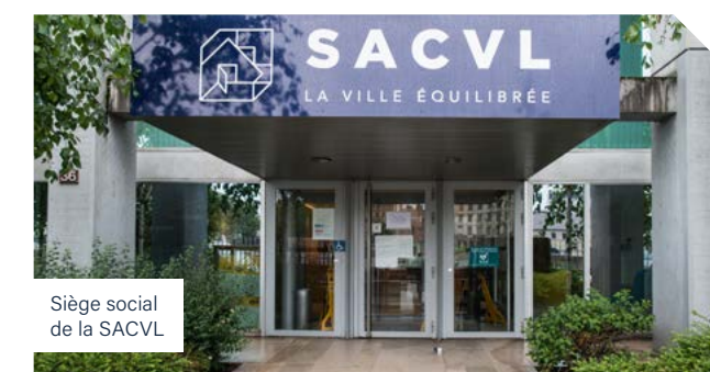
Siège social de la SACVL

En dehors des heures d'ouverture et en cas d'urgence, vous pouvez prendre contact avec notre astreinte SERVIMO au 04 78 79 35 30 pour une intervention rapide. Pensez à consulter les panneaux d'affichages dans vos allées. Afin de réduire votre temps d'attente au standard, veuillez vous munir de votre référence locataire, indiqué sur votre avis d'échéance. Les chargés d'accueil vous rappellent également de bien penser à transmettre chaque année votre nouvelle attestation d'assurance à l'adresse > assurances@sacvl.fr