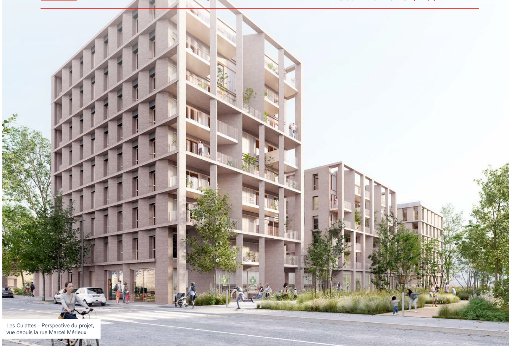
Les Culattes - Perspective du projet, vue depuis la rue Marcel Mérieux