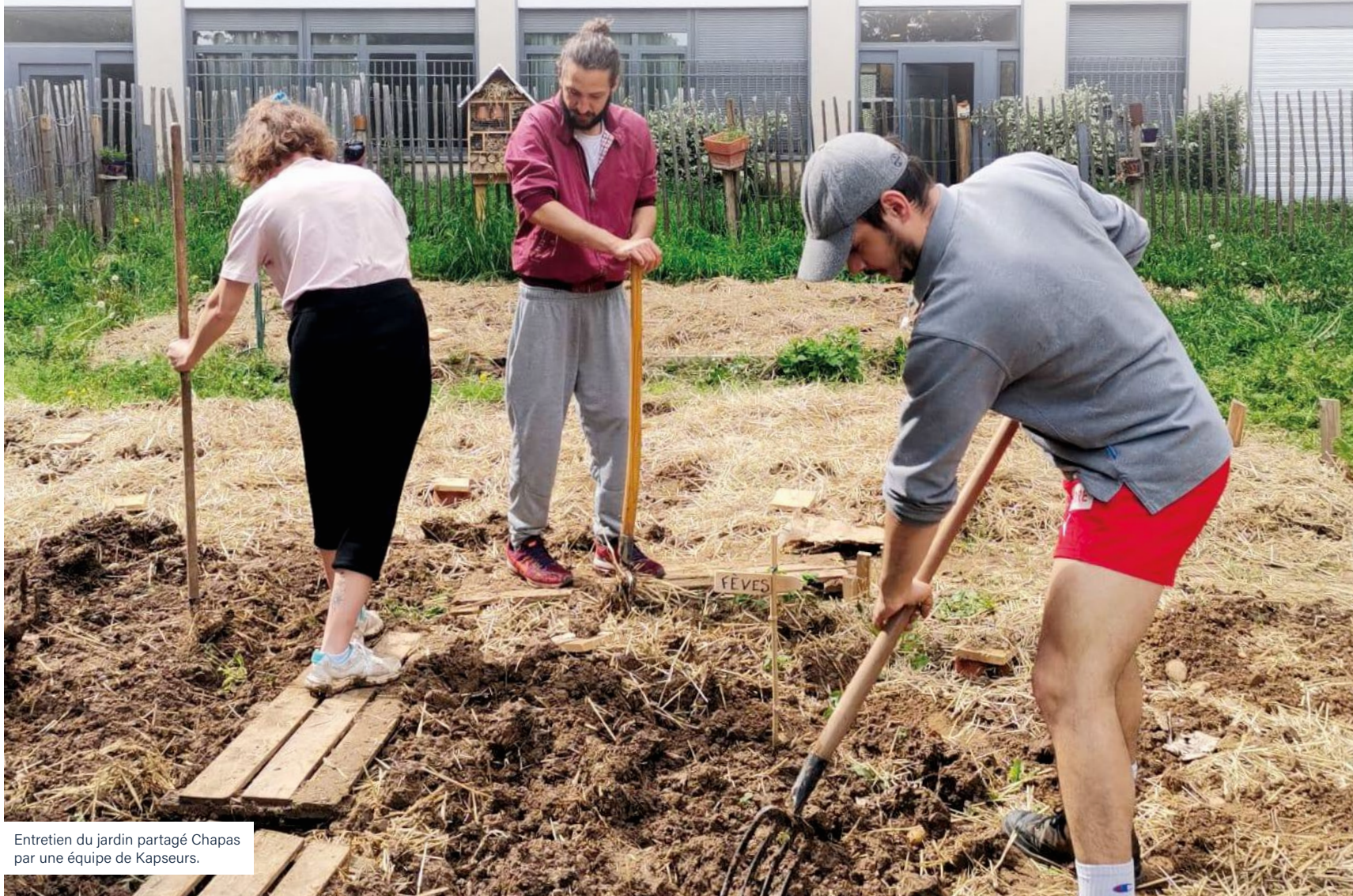
Entretien du jardin partagé Chapas par une équipe de Kapseurs.