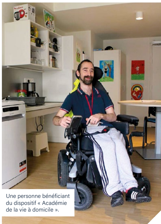
Une personne bénéficiant du dispositif « Académie de la vie à domicile ».

L : La cohabitation se passe vraiment très bien. Peut-être parce que dans ces quartiers, à la Duchère par exemple, la solidarité est bien réelle. Peut-être aussi parce que la SACVL est historiquement impliquée dans une démarche médico-sociale importante. Peut-être parce que j'ai, moi-même, travaillé un temps à la SACVL. Quoi qu'il en soit, nous ne pouvons que nous féliciter de ces résultats de ce dispositif inclusif. •