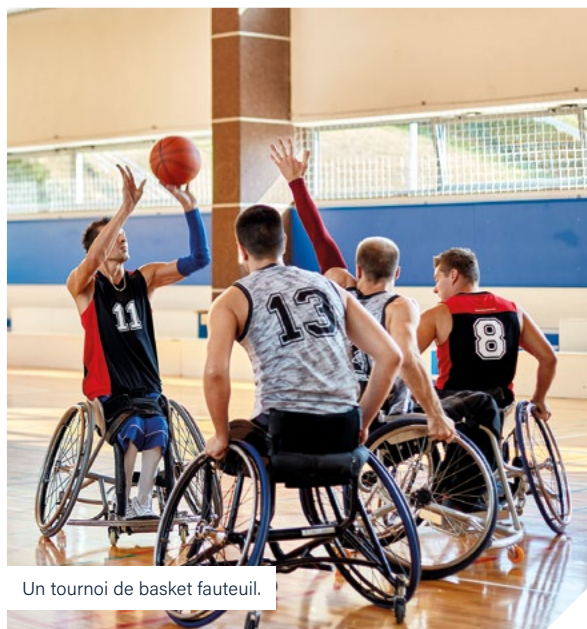
Un tournoi de basket fauteuil.

Le 4 septembre 2024, une journée exceptionnelle se profile pour une soixantaine d'élèves du collège Victor Schoelcher à la Duchère dans le 9 e arrondissement. Inscrits en sport-études ou membres de l'association sportive du collège, ces élèves auront le privilège d'assister à un tournoi de basket fauteuil à l'Arena Bercy, pendant les Jeux Olympiques et Paralympiques de Paris 2024. Cette sortie, réalisée dans le cadre d'un deuxième mécénat avec la SACVL, ne constitue qu'une facette d'une programmation plus vaste. Le collège Victor Schoelcher a récemment obtenu le label « Génération 2024 », soulignant son engagement envers la promotion de la pratique sportive et des valeurs olympiques. Tout au long de l'année, plusieurs actions sont mises en place : rencontre de sportifs de haut niveau, défi olympique... Les collégiens ont notamment créé des dossards, des porte-drapeaux, et chaque classe a pu interpréter des hymnes nationaux de divers pays. En complément, la Semaine olympique et paralympique, prévue du 2 au 6 avril, promet d'être un autre temps fort de cette année scolaire. En présence du recteur, les élèves pourront assister à une table ronde mettant en lumière les sportives ayant milité pour les droits des femmes et l'égalité, et participeront à des activités liées au handisport, en collaboration avec des éducateurs de sports adaptés. Une journée et une année qui s'annoncent inoubliables, marquées par les valeurs du sport, du fair-play et de l'inclusion.