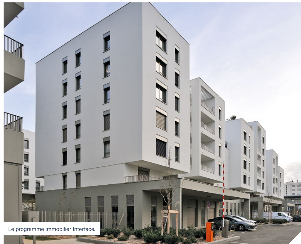
Le programme immobilier Interface.