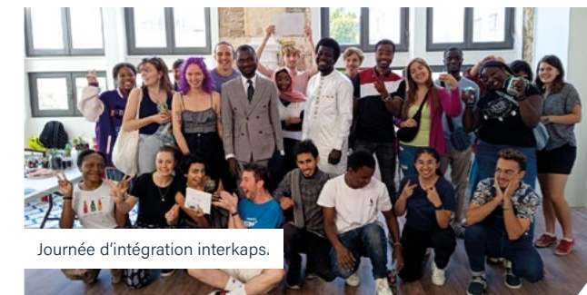
Journée d'intégration interkaps.