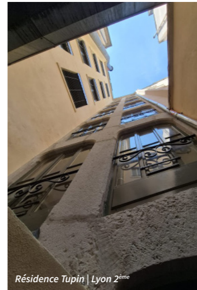
Résidence Tupin | Lyon 2ème

La trajectoire s'appuie également sur un travail d'études et d'audits pour orienter les futures opérations : études en cours sur plusieurs résidences (Perspective Saône, Jean Fauconnet), audit énergétique réalisé à la Grande Côte, et préparation opérationnelle aux Brotteaux pour des travaux d'isolation de toiture.