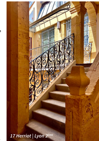
17 Herriot | Lyon 2ème

⇒ Des réhabilitations globales ont été livrées sur les résidences Pierre Bayard et 17 Herriot (photo ci-contre). D'autres opérations structurantes sont en cours ou engagées, notamment aux Tchécoslovaques et à Tupin (photo ci-dessous), intégrant des rénovations énergétiques complètes. ⇒ Des interventions ciblées complètent cette dynamique, comme le remplacement des menuiseries (Le Lac) ou la création de systèmes de ventilation assistée (Louis Mouillard).