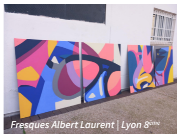
Fresques Albert Laurent | Lyon 8 ème

Action Sport Education y mène une action d'éducation civique par le sport et a accompagné le financement de colonies apprenantes pour 10 jeunes de la résidence, autour d'activités telles que l'escalade, le rafting, la baignade, l'accrobranche ou encore la randonnée. Un chantier jeunes a également permis la création d'une fresque en anamorphose et de 8 tableaux réalisés avec 8 jeunes issus du quartier prioritaire de la politique de la ville, avec l'appui de partenaires spécialisés. À cela s'ajoutent de l'aide aux devoirs avec la MJC , de l'accompagnement administratif avec Passerelle , des ateliers de proximité avec Raid Aventure (escalade, boxe, secourisme, activités sportives collectives, ateliers de sensibilisation et de débat), ainsi que des ateliers de jardinage et de fleurissement avec SP Action , contribuant au reverdissement de la résidence. Dans la résidence Ambroise Paré Laënnec , le partenariat prend une forme plus ponctuelle mais tout aussi structurante. La SACVL soutient la fête de quartier du Centre social