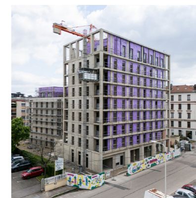
Résidence Chemin des Îles - Bâtiment A | Lyon 7 ème