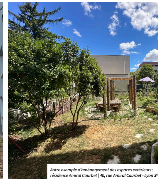
Autre exemple d'aménagement des espaces extérieurs : résidence Amiral Courbet | 40, rue Amiral Courbet - Lyon 3 ème