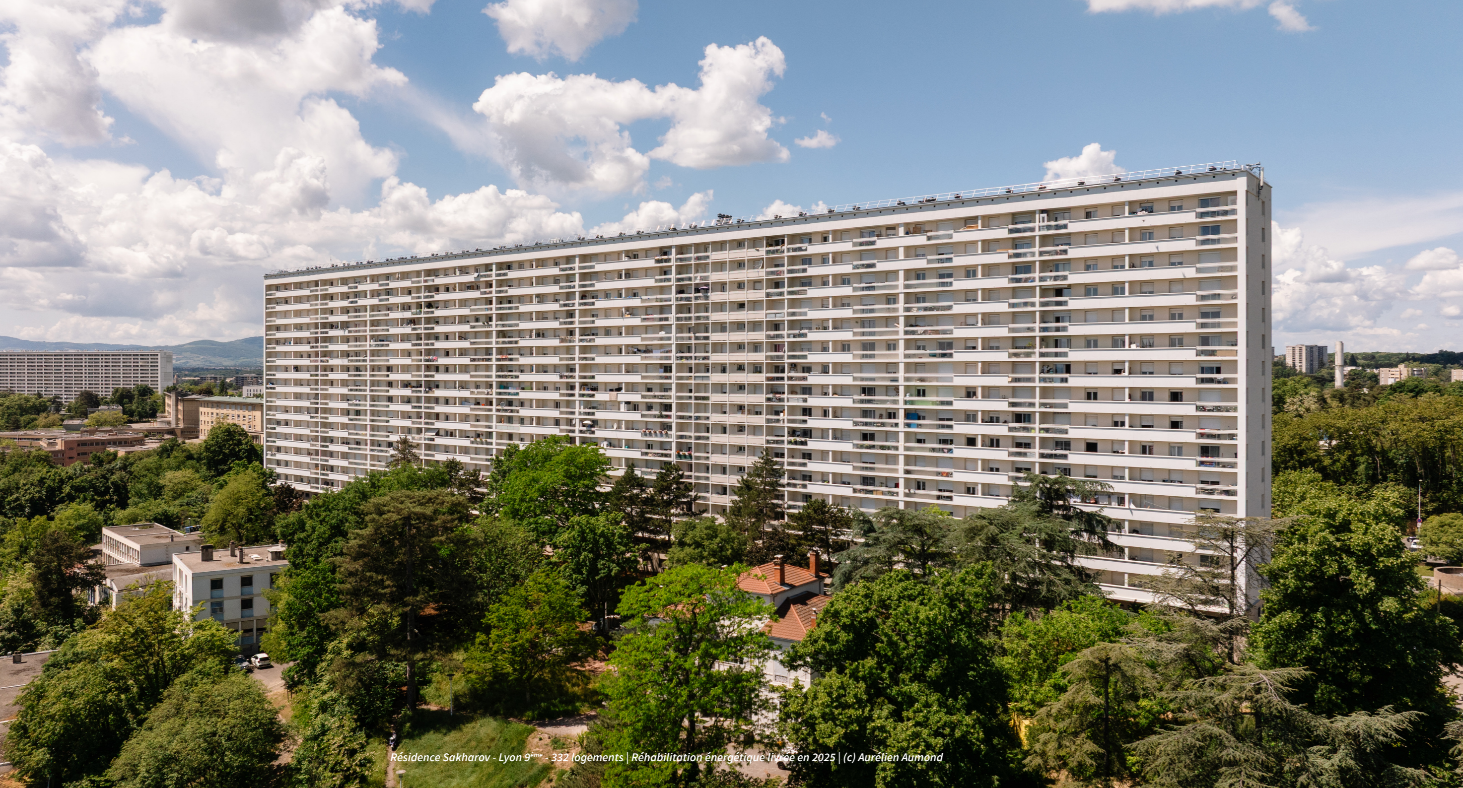
Résidence Sakharov - Lyon 9 ème - 332 logements | Réhabilitation énergétique livrée en 2025