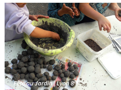
Fête au Jardin | Lyon 8 ème

Dans le 8 ème arrondissement de Lyon, la SACVL déploie un ensemble d'actions partenariales qui illustrent concrètement sa manière de créer de la valeur avec les acteurs du territoire. Ces coopérations associatives répondent à des besoins très divers du quotidien : accompagnement des enfants