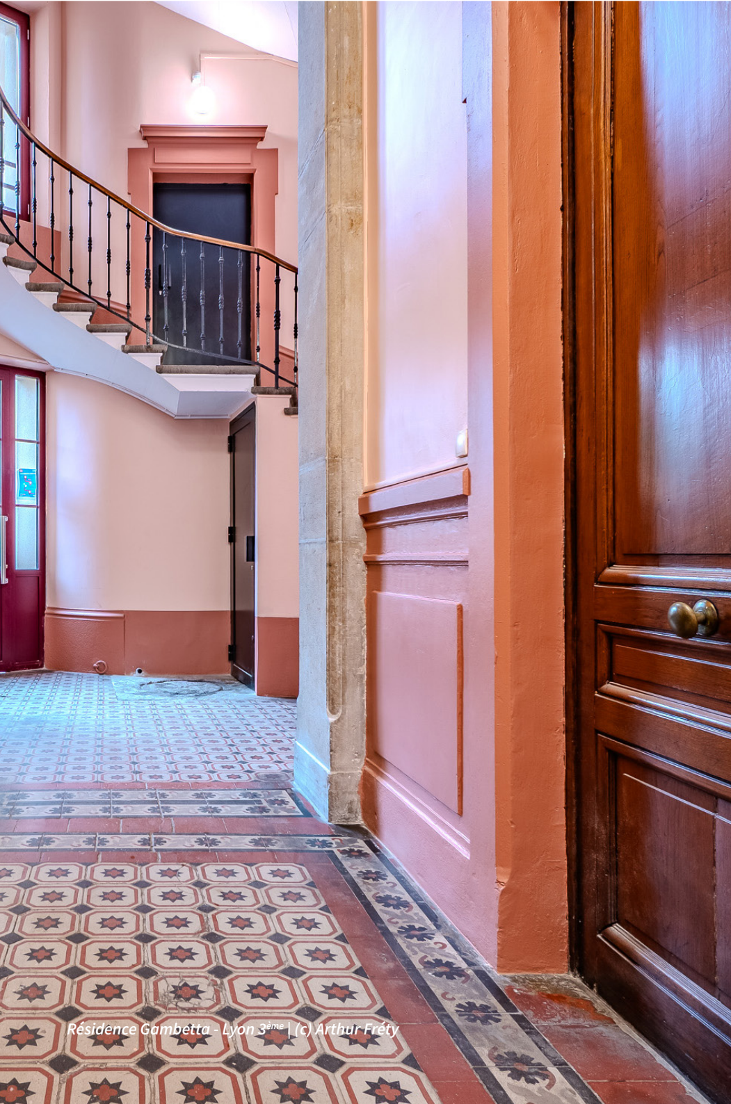
Résidence Gambetta - Lyon 3 ème