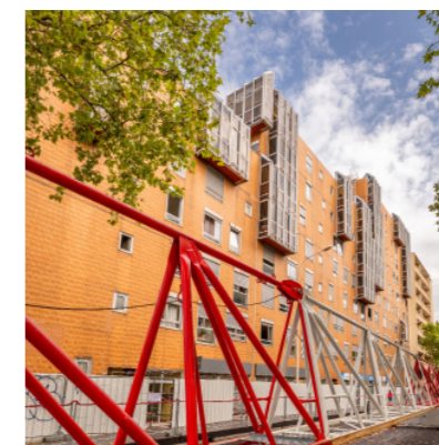
Résidence Garibaldi | Lyon 7 ème