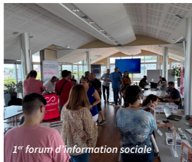
1 er forum d'information sociale

Le 24 juin 2025, la SACVL a organisé son premier forum d'information sociale, ouvert à l'ensemble du personnel. Pendant un après-midi, les salariés ont pu échanger directement avec différents partenaires, sous forme de stands, de présentations collectives ou d'entretiens individuels, sur des thématiques liées à leur vie professionnelle et personnelle :