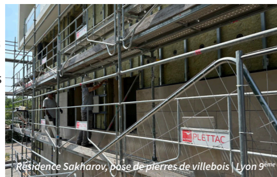
Résidence Sakharov, base de pierres de villebois | Lyon 9ème

La trajectoire énergétique du patrimoine s'inscrit dans un objectif de long terme visant 100 % de logements classés A à D d'ici 2034. En 2025, cette ambition se concrétise avec 87,5 % de logements classés A à D , illustrant les effets combinés des réhabilitations énergétiques livrées et de la systématisation des travaux dans les logements