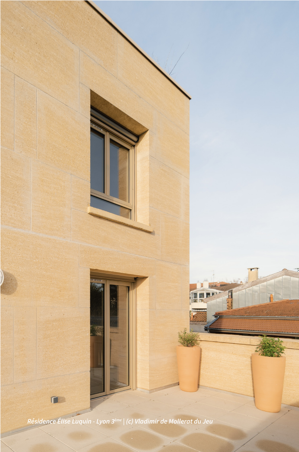
Résidence Élise Luquin - Lyon 3 ème | (c) Vladimir de Mollerat du Jeu