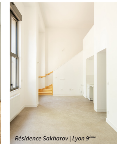
Résidence Sakharov | Lyon 9 ème