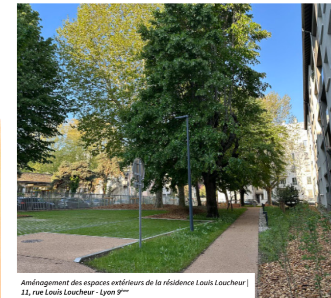
Aménagement des espaces extérieurs de la résidence Louis Loucheur | 11, rue Louis Loucheur - Lyon 9 ème