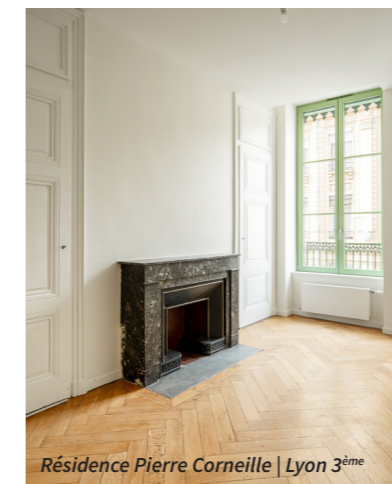
Résidence Pierre Corneille | Lyon 3 ème

Par ailleurs, sur la résidence Pierre Corneille , un partenariat avec l'association Alynea permet de proposer un accompagnement adapté à des publics en situation de fragilité au sein de 4 logements PLAI, contribuant ainsi à sécuriser les parcours résidentiels et à renforcer l'inclusion.