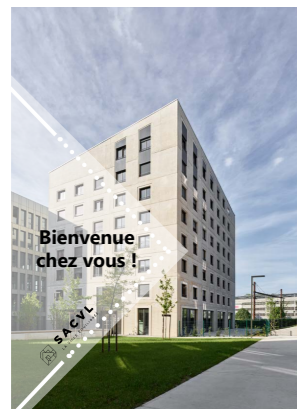
Livret d'accueil du locataire