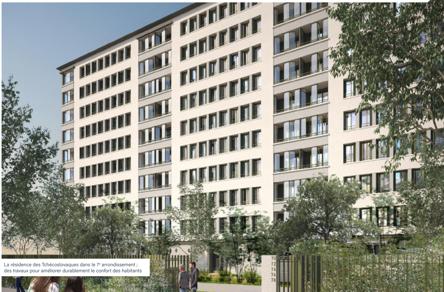
La résidence des Tchécoslovaques dans le 7 e arrondissement ; des travaux pour améliorer durablement le confort des habitants